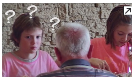
Na hosty čekalo v restauraci čokoládové překvapení.

A s překvapením počítá také virální video, které Mondelez uvedl na internetu a jež do této chvíle zaznamenalo přes 200 tisíc zhlédnutí. Zaskočené hosty nakonec uchlácholila právě nová čokoláda.